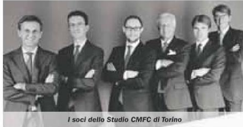
I soci dello Studio CMFC di Torino