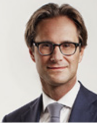
J. Hoekstra Nineyards Law

“ De Orde van Advocaten stelt namelijk hoge eisen aan de beveiliging. Alexander gaf groen licht en dus besloten we vanaf de eerste dag met Kleos te werken. ”