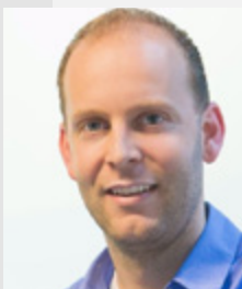
R. Sjaardema Smart Letselschade

“ De Orde van Advocaten stelt namelijk hoge eisen aan de beveiliging. Alexander gaf groen licht en dus besloten we vanaf de eerste dag met Kleos te werken. ”