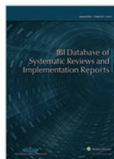
JBI Database of Systematic Reviews and Implementation Reports Lippincott