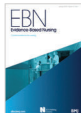
Evidence-Based Nursing BMJ