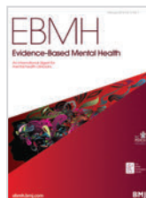
Evidence-Based Mental Health BMJ