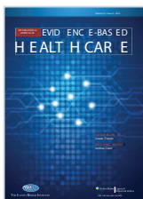
International Journal of Evidence-Based Healthcare Lippincott