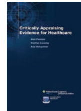
Critically Appraising Evidence for Healthcare Lippincott

*También forman parte de una serie de libros; se están agregando nuevos libros!